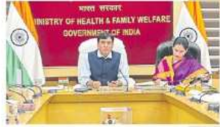
6 వేల మార్కు దాటిన కోవిడ్ కేసులు

అభిప్రాయపడ్డారు. కేంద్రం, రాష్ట్రాలు కలిసి పని చేయాలి గతంలో కరోనా వ్యాప్తి ఉధృతంగా ఉన్న సమయంలో కేల డ్రం, రాష్ట్రాలు కలిసికట్టుగా పనిచేశాయని, చట్టపై పరి తాలు సాధించాయని మాండవీయ గుర్తుచేశారు. ఇప్పుడు మూడో అదే తరహాలో సమస్యయంతో పనిచేయాలన్నారు. పరస్పరం సహకరించుకోవాల్సిన అవసరం ఉందని చెప్పారు. ఆరోగ్య శాఖ సన్నద్ధతపై ఈ సెల 8, 9వ తిర్రాల అధికారులతో సమీక్ష నిర్వహించాలని రాష్ట్రాల ఆరోగ్య శాఖ మంత్రులకు పిలుపునిచ్చారు. 10, 11వ అనుచ త్రుల్లో మౌలిక సదుపాయాలపై మార్కెట్లో నిర్వహించాల న్నారు. కొత్త వేరియంట్లతో సంబంధం లేకుండా వైరస్ నియంత్రణకు ఐదు అంబెల ప్ల్యాన్లన్నీ అమలు చేయాలని వివరించారు. టెస్ట్-ట్రాక్-ట్రేస్-వ్యాక్సినేషన్ తో పాటు కోవిడ్-19 నియంత్రణ చర్యల చర్యల అమలుతో సత్ఫలితాలు లభిస్తాయని చెబుతూండారు. అధ్యక్షుల వారం చర్యల కరోనా డేరాల ఇవ్వాలన్నారు. ముఖ్యంగా వ్య వులు, అలాంటివారితో బాధపడేవారిపై ప్రత్యేకంగా శ్రద్ధ