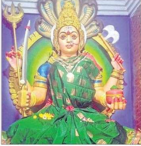
పెదముషిడివాడలో వెలసిన పైడిమాంబ ముఖ చిత్రం