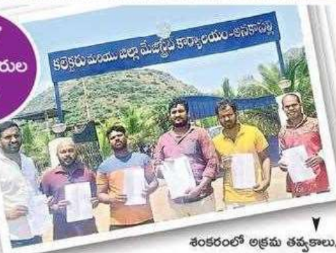
శంకరంలో అక్రమ తవ్వకాలు, నిర్మాణాలపై స్థానికుల పిర్యాదు (పాత చిత్రం)

ఆక్రమణలు వంటి వాటిపైనే ఎక్కువ పిర్యాదులు వచ్చాయి. తర్వాత వందలబీరాజ్ శాఖ నుంచి 2,415 అర్జీలు వచ్చాయి. వీటిలో ఎక్కువగా చేసిన పనులకు టీబిలు ఇవ్వలేదని, మంచాయితీ స్థలం ఆక్రమణలు, పారిశుధ్యం, సంపద కేంద్రాల నిర్వహణ, తాగునీటి సౌకర్యం పనులపై ఎక్కువ పిర్యాదులం దాయి. ఆ తర్వాత పోలీసు, తవడిసీపిల్, గృహనిర్మాణ, ఊరిముల సర్వే, రికార్డులు, పౌరసేవకారాల శాఖల నుంచి అర్జీలు ఎక్కువ సంఖ్యలో వచ్చాయి. వీటిని నిర్దేశిత గడువులోగా పరిష్కారం చూపాలి. పరిష్కరించవంటే అందుకు కారణాలను పొందుపర్చాలి. గడువు మీరి సమస్యలు పరిష్కారం కాకుండా ఉంటే ఉన్నతాధికారులకు వివరణ ఇచ్చుకోవాలి ఉంటుంది. అందుకే చాలావరకు స్పందన అర్జీలను ఏదో సమాధానంతో మూసేస్తున్నారన్న ఆరోపణలూ ఉన్నాయి.