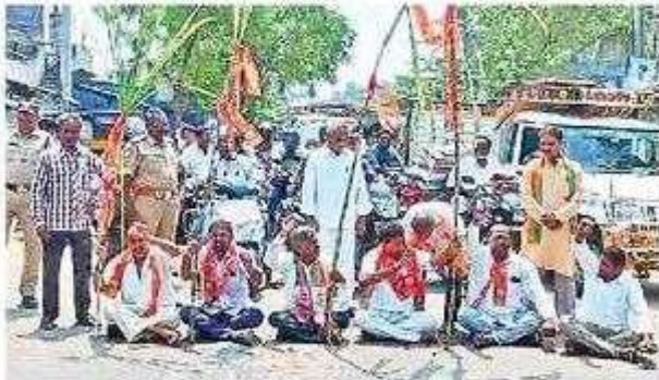
గోవాడ చక్కెర కర్మాగారం ముందు బి-ఎన్ రహదారిపై బైరాయించిన నాయకులు