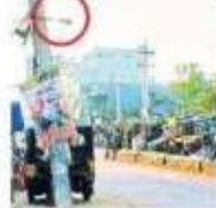
బాజాక్ షెల్టర్లో సీసీ కెమెరా అను పనిచేయిస్తున్న పోలీసులు (ఇన్సైట్లో) మాకవరపాలెం జి.స్టాండ్ వద్ద విరువయోగంగా ఉన్న సీసీ కెమెరా

సంబంధించిన నగదు చోరీ కేసు ఛేదనలో తీవ్ర జాప్యం జరుగుతోంది. పరితంగా జి.జా.కే, సీ.కే.చోండా పోలీసులలో ఉన్న సీసీ కెమెరాల ఫుటేజీలతో చోరీ నులు ఐదు రోజులుగా నానా కంటాలు పడుతున్నారు. ఇప్పటికైనా ఆదికారులు మెయిన్ రోడ్డులో ఉన్న సీసీ కెమెరాలు పనిచేసినా తగిన చర్యలు చేపట్టాలని మండల ప్రజలు కోరుతున్నారు.