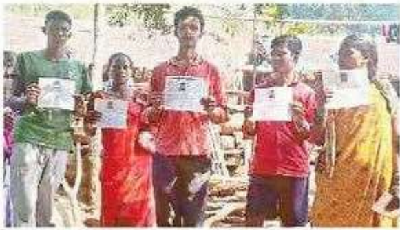
కార్డులు ప్రదర్శిస్తున్న ఆదివాసులు

యారు. ఆదికారులు స్పందించి వెంటనే ఉపాధి పనులు కల్పించకుంటే ఈనెల 18న కలెక్టర్ కార్యాలయం వద్ద నిరసన కార్యక్రమం చేపడతామని స్పష్టం చేశారు.