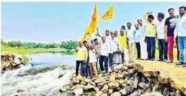
దెబ్బతిన్న గ్రోయిన్ ను పరిశీలిస్తున్న తెదేపా నాయకులు