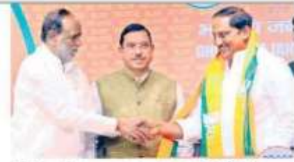
డిల్లీలో జాతీయ వాయుశుభ సమన్వయంలో టీజేపీలో చేరుతున్న మాజీ సీఎం కిరణ్ కుమార్ రెడ్డి