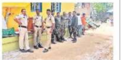
తిమ్మాపురం గ్రామంలో మోహరించిన ప్రత్యేక పోలీస్ బందగాలు