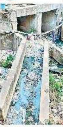
అధ్యానంగా ఎల్లయ్య కాలువ

రెవెన్యూ నుంచే అధికం.. అనకాపల్లి జిల్లా ఏర్పడిన ఈ ఏడాదిలో 76 ప్రభుత్వశాఖలు, విభాగాలకు సంబంధించిన సమస్యలపై 17,098 మంది స్పందనలో అర్జీలు పెట్టారు. వీటిలో అత్యధికంగా రెవెన్యూ శాఖకు సంబంధించిన అర్జీలే 6,891 వరకు ఉన్నాయి. ఊరివిడాలూ, పట్టణాల పాపపుస్తకాలు, మ్యూటీషన్లు,