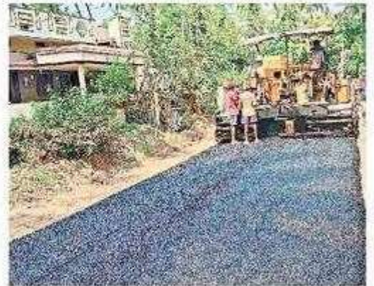
తిమ్మరాజుపేట నుంచి కుమారపురం వరకు వేస్తున్న తారురోడ్డు

అచ్యుతాపురం, స్కాన్ టుడే: అత్యంత ప్రమాదకరంగా ఉన్న అచ్యుతాపురం-అసకాపల్లి రోడ్డుకు కనీస మరమ్మతులు చేయడానికి ముందుకు రాని ఆర్ అండ్ బీ అధికారులు అందంగా కనిపిస్తున్న రోడ్డు తిరిగి నిర్మించడానికి ఉత్సాహం చూపారు. ప్రమాదకరమైన గోతులు, ఎగిసి పడుతున్న ధూళితో రోజూ రాకపోకలు సాగించే వెలాడి మంది వాహనచోదకులకు నరకం చూపిస్తున్న ప్రధాన రహదారిని పట్టించుకోని జిల్లా యంత్రాంగం శేవలు ఐదు గ్రామాలకు ఉపయోగపడే రోడ్డును మాత్రం రూ. కోటితో తిరిగి నిర్మించే పనులను చేపట్టింది. అచ్యుతాపురం మండలంలో తిమ్మరాజుపేట నుంచి మునగపాక మండలం కుమారపురం వరకు 6.1 కిలోమీటర్ల ఆర్ అండ్ బీ రోడ్డు నిర్మాణ పనులు రెండురోజులుగా చకచకా జరుగుతున్నాయి. ఈ రోడ్డు పనులు చూసిన ప్రజలు బాగున్నా రోడ్డుపై మళ్లీ తారువేసే బదులు అచ్యుతాపురం-అసకాపల్లి రోడ్డులో గోతులు పూడ్చించాలని సిబ్బంది కోరారు.