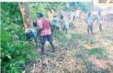
మునగపాకలో కృష్ణరాజు కాలువ గుట్టు శ్రమదానంతో బాగుచేస్తున్న రైతులు (పాత చిత్రం)

జిల్లా కలెక్టరేట్‌లో ప్రతివారం నిర్వహించే స్పందన కార్యక్రమానికి వందల సంఖ్యలో అర్జీలు వస్తున్నాయి. స్పందనలో కాగితం ఇస్తే సమస్య వెంటనే పరిష్కారం అవుతుందన్న ఆశతో దూరాభ్యర్థులూ జిల్లా కేంద్రానికి ప్రజలు వస్తున్నారు. వ్యక్తిగత, సామాజిక సమస్యలపై అధికారులకు పిర్యాదులు చేస్తున్నారు. అయితే వీటిలో కొన్నింటికే అధికారులు పరిష్కారం చూపగలగరుతున్నారు. మిగతా వాటికి 'ఇది ఆర్థిక పరమైన ఆంకం.. ప్రభుత్వ పరిశీలనలో ఉంది.. సోషల్ ఆడిట్ జరుగుతోంది.. న్యాయపరంగా తేల్చుకోవాలి..' అంటూ సమాధానాలు వస్తున్నాయి. అయితే పిర్యాదులను మూసేస్తున్నారు. స్పందన అర్జీల్లో 95 శాతం పరిష్కారం అవుతున్నట్టు గణాంకాలు చూపుతున్నా క్షేత్రస్థాయిలో వాటి పరిస్థితి భిన్నంగా ఉంటోంది. తమ సమస్యల పరిష్కారం కోసం పదేపదే కలెక్టరేట్ చుట్టూ తిరుగుతున్నవారు అనేకం ఉన్నారు.