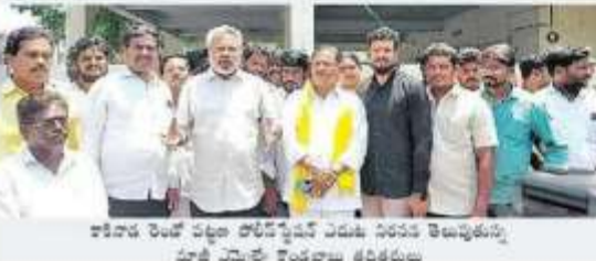
కాకినాడ లోనే చట్టం తొలగించిన ఏడేడే నిరసన తెలుపుతున్న మార్చి 26న పోలీసులకు తెదేపా నిరసన

కాకినాడ (మీడియాసెంటర్), మార్చి 26: వైసాపా ప్రభుత్వంలోకి విచారణ పోలీసులకు సామాజిక మాధ్యమాలలో పోస్టులు పెట్టినారంటూ ప్రచారం చేశారు. తరచుగా అందజేయడం అత్యంత అలభ్యంగా పోస్టులు పెట్టి వారిపై చర్యలు తీసుకోవచ్చు.