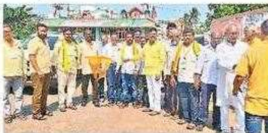
జెండాఊపి ర్యాలీ ప్రారంభిస్తున్న ప్రగడ

పాయకరావుపేట, స్కాస్ టుడే: విశాఖలో బుధవారం జరిగిన టోన్-1 తెదేపా సమావేశానికి పాయకరావుపేట నుంచి నాయకులు తరలివెళ్లారు.