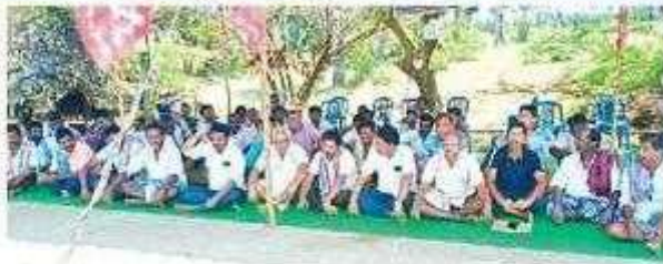
సెజ్లో రసూల్ డెకర్ పరిశ్రమ ఎదుట కలాశీల ఆందోళన

రాంచిల్లి, స్కాస్ టుడే: సెజ్లో రసూల్ డెకర్ పరిశ్రమ యాజమాన్యం నిర్వాసితుల పొట్ట కొట్టేందుకు దుర్మార్గపు చర్యలకు దిగిందని సీఐటీయూ