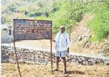
గతంలో ఏర్పాటు చేసిన హెచ్చరిక బోర్డు

బరితెగించారు. ఆక్రమిత స్థలాల్లో రెవెన్యూ హెచ్చరిక బోర్డులను రాత్రికి రాత్రి పేసే మాయం చేసేశారు. మళ్లీ పునాదుల్లో సుట్టే కప్పేసి దొంగ పట్టాలలో దర్జాగా అమ్మేస్తున్నారు. ఇదే సర్వే నంబరులో ఖైలర్స్ కాలనీ సమీపంలో రహదారిని ఆనుకొని కొంత స్థలాన్ని కబ్జా చేసి దుకాణ సముదాయం నిర్మిస్తున్నారు. రెవెన్యూ అధికారులు సైతం ఏమీ చేయలేక చేతులు ఎత్తేశారు. పోలీసులకు ఫిర్యాదు చేసినా, ఆటో ప్రచారాలు నిర్వహించినా ఆక్రమణదారులు ఏ మాత్రం లెక్క చేయడం లేదు. ఇలాగే వదిలేస్తే మిగిలిన స్థలాలను అమ్మేస్తారని గ్రామస్థులు అవేదన వ్యక్తం చేస్తున్నారు.