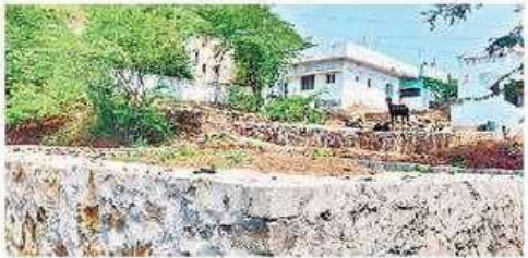
హెచ్చరిక బోర్డు తొలగించి పునాది స్థలంలో కట్టిన మట్టి

ఓ పక్క ఇంటి నిర్మాణం పనులు ప్రారంభించకపోతే పట్టా రద్దు చేసి మరొకరికి కేటాయిస్తామని అధికారులు హెచ్చరిస్తున్నా లభిదారులు ఖాతరు చేయడం లేదు. చోడవరం మండలం కన్నంపాలెం-టి.జగన్నాధపురం కూడలిలో