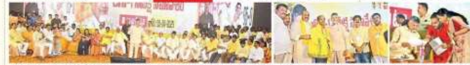
వేదవేదికపై ఆంధ్రప్రదేశ్ సర్కారంతో కలవాలి వేదలు, కార్యదర్శులు

వేద వేదవేదికపై ఆంధ్రప్రదేశ్ సర్కారంతో కలవాలి వేదలు, కార్యదర్శులు