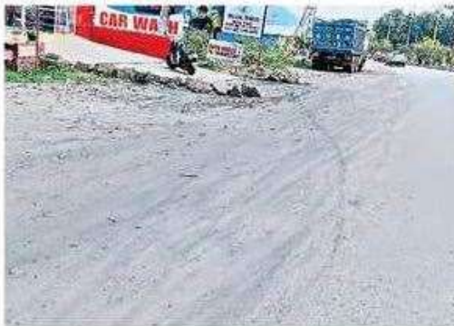
రహదారి పక్కన బూడిద మేటలు

వాడ వెళ్లే మార్గంలో రోడ్డు అంచులు వెంబడి బొగ్గు పేరుకుపోయింది. ఈ మార్గం వెంబడి పార్కాసిటీ, పాలవలస, అచ్యుతాపురం లోని కంపెనీలకు నిత్యం వందలాది బొగ్గు లారీలు ప్రయాణిస్తుంటాయి. అయితే పరిమితికి మించి అధికలోడుతో వెళ్లడంతో పాటు టార్పాలిన్లు సరిగా కట్టకపోవడంతో బొగ్గు రాలి కింద పడు