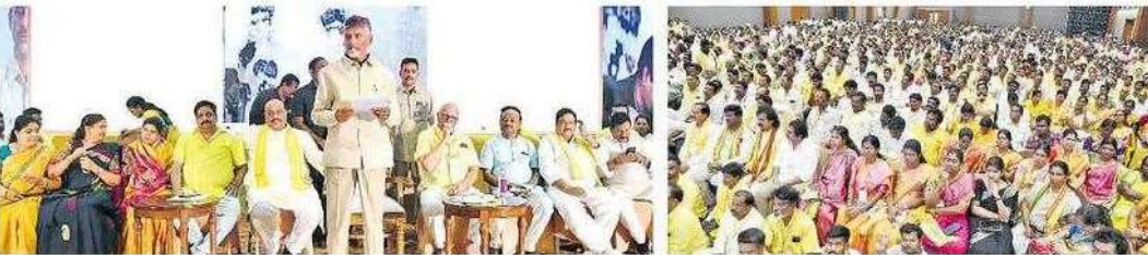
సమీక సమావేశంలో మాట్లాడుతున్న తెదేపా అధినేత చంద్రబాబు, వెదికపై ఉత్తరాంధ్ర జిల్లాల నేతలు, ప్రజాప్రతినిధులు ★ హజరైన నేతలు, కార్యకర్తలు

(మొదటి పేజీ తరువాయి) విశాఖపట్నంలో ఐదువారం నిరసించిన కోసా-1 సమీక సమావేశంలో చంద్రబాబు మాట్లాడారు. ఉత్తరాంధ్రలోని ఆరు జిల్లాల నాయకులు, నియోజకవర్గ ఇన్ చార్జ్ లతో కుటుంబ సాథికార సారథి నియామక ప్రక్రియ, ఓటర్ల జాబితా తనిఖీ, 'ఇదేం జర్నల్ రాష్ట్రానికి' కార్యక్రమంపై వర్ణించారు. నియోజకవర్గాలు, క్రస్టర్లు, యూనిట్ల పాఠికా మొదటి పది స్థానాల్లో నిలిచిన వారిని అభినందించారు. బాక్ స్టాంపుల్లో కొత్త సభ్యులపై దృష్టి సారించాలన్నారు. ప్రతి ఏడుగురు ఓటర్లలో ఒకరు పార్టీ సభ్యులను పోలికా చూడాలని శ్రేణులకు పిలుపునిచ్చారు. కుటుంబ సాథికార సారథి నియామకం ద్వారా ప్రతి ఇంటిని జియోట్యాగ్ చేయనున్నట్లు చెప్పారు. జగన్ రాజకీయాలకు అనర్హుడు 'మనిషి ఎప్పుడూ భూమిపై నడవాలి. కానీ జగన్ ఆకాశంలో నడిచాడు. పరదాల చాటున నడిచాడు, అర్థ