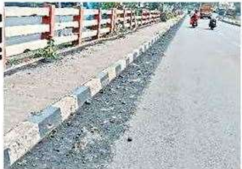
లంకెలపాలెం పైవంతెనపై పేరుకుపోయిన బొగ్గు

డంతో వేగనియంత్రీకలు వద్ద బొగ్గు కింద పడటంతో పాటు గాలికి ఎగిరి వెనకాల వచ్చే వాహనదారులు తీవ్ర ఇబ్బందులు పడుతున్నారు. జాతీయ రహదారి లంకెలపాలెం కూడలి నుంచి పర