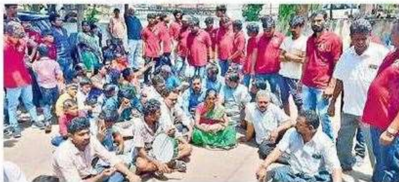
నక్కపల్లి పోలీసు స్టేషన్ ఎదుట వీసం మద్దతు దారుల ఆందోళన