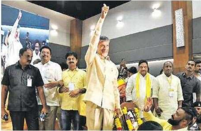
విజయ చిహ్నం చూపుతున్న తెదేపా అధినేత చంద్రబాబు