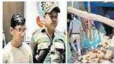
పోలీస్ కస్టడీలో నిందితుడు సర్దు.. పేలుడు ధాటికి ధ్వంసమైన ఇల్లు

చత్తీస్ గఢ్ లో పెళ్లికి బహుమతిగా వచ్చిన హోం థియేటర్ మ్యూజిక్ సిస్టం వేలి నవవరుడు మృత్యుచెందిన ఘటనలో సంవలన విషయం బయటపడింది. కొత్తజంటను చంపేందుకు పదుపు మాజీ ప్రియుడు ఆ హోం థియేటర్ లో బాంబు పెట్టి కాసుకగా