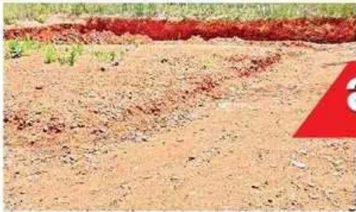
బెన్నవోలులో కొండను తవ్వి నిర్మాణానికి అనువుగా..