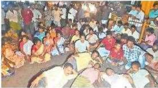
జాతీయ రహదారిపై బైరాయించిన వీసం మద్దతుదారులు

మేరకు విశాఖ-విజయవాడ మార్గంలో రాకపోకలను నిలిపేశారు. దీంతో ఇరువైపులా ట్రాఫిక్ నిలిచిపోయింది. చివరకు ఎంపీపీ పిర్యాదు చేసిన ముగ్గురు వ్యక్తులపై 923, 509, 506, 34 సెక్షన్లతో