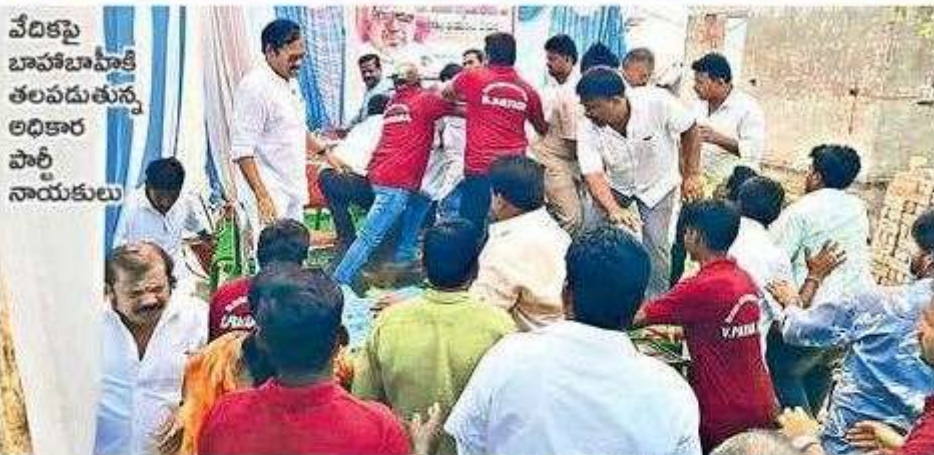
వేదికపై బాహుబాహికి తలపడుతున్న అధికార పార్టీ నాయకులు

పా యకరావు పేట వైకాపాలో విభేదాలు మరోసారి భగ్గుమన్నాయి. బుడవారం జగ్గీవన్ రామ్ జయంతి సభ సాక్షిగా... ఎమ్మెల్యే ఎదురుగానే బాహుబాహికి దిగారు. ఎమ్మెల్యేకు వ్యతిరేకుగా లోడైక్యారు. జాతీయ రహదారిపై ఎమ్మెల్యే వ్యతిరేక వర్గీయులు బైచాయింది ఆందోళన దిగడంతో భారీగా క్రాపిక్కు ఆంతరాయం ఏర్పడింది. సుమారు అరగంటపాటు చెన్నై-కోల్ కత్తా జాతీయ రహదారిపై భారీగా వాహనాలు నిలిచిపోయాయి. -స్యాస్టుడే, నక్కపల్లి