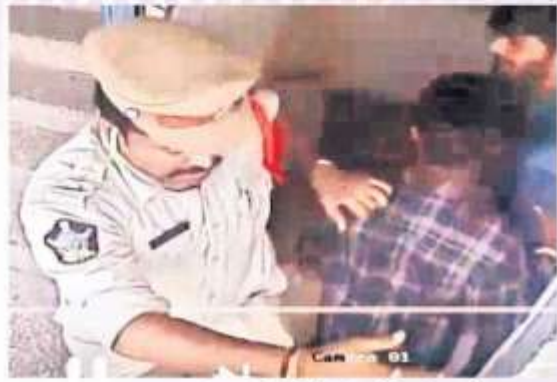
విద్యార్థిని సెట్టివేస్తున్న ఎన్ఐ దివైదర్

ప్రారంభించారు. సమీపంలో వున్న డీపీఎన్ కళాశాల మేడ మీద నుంచి ఒక విద్యార్థి 'జై జనసేన' అంటూ డిగ్రీగా నినాదం చేశారు. అది మంత్రికి వినపడడంతో ఆయన ప్రసంగాన్ని ఆపారు. అక్కడే విరుల్లో ఉన్న ఎన్ఐ దివైదర్ కు పిలిచి, అరిచింది ఎవరో చూడమని ఆదేశించారు. వెంటనే ఎన్ఐతోపాటు కొంతమంది వైసిపీ నాయకులు కళాశాలలో రెండో అంతస్తుకు వెళ్లారు. పలువురు విద్యార్థులపట్ల దురుసుగా ప్రవర్తించారు. ఒక విద్యార్థి చొక్కా కాలర్ పట్టుకుని మెట్ల వరకు ఈడ్చుకు వచ్చారు. దీనిపై కళాశాల ప్రెసిడెంట్, సెల్లంది అభ్యంతరం వ్యక్తం చేయడంతో విద్యార్థిని విడిచిపెట్టి ఎన్ఐ అక్కడి నుంచి