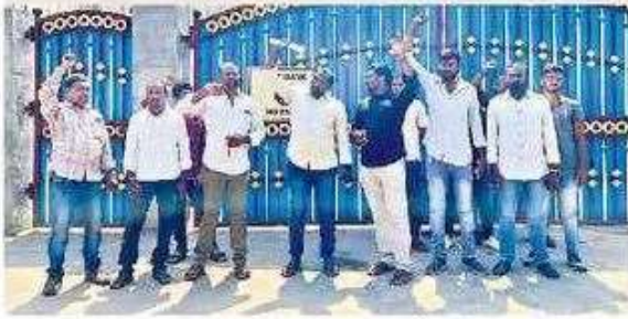
పరిశ్రమ ఎదుట నిరసన తెలుపుతున్న గుత్తేదారులు, కార్మికులు