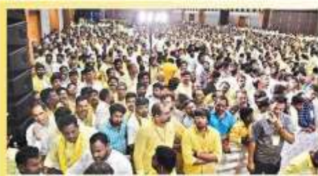
వేదవేదికపై ఆంధ్రప్రదేశ్ సర్కారంతో కలవాలి వేదలు, కార్యదర్శులు