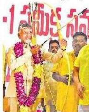
విల్లు ఎక్కువేట్లీ బాణం సంధిస్తున్న అధినేత చంద్రబాబు